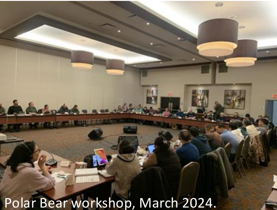
Polar Bear workshop, March 2024.

Time for people to speak and ask questions, and for the Board to hear.